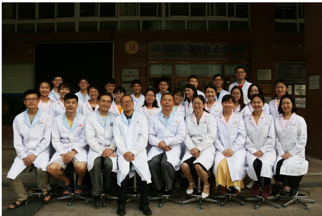
实验室课题组合影