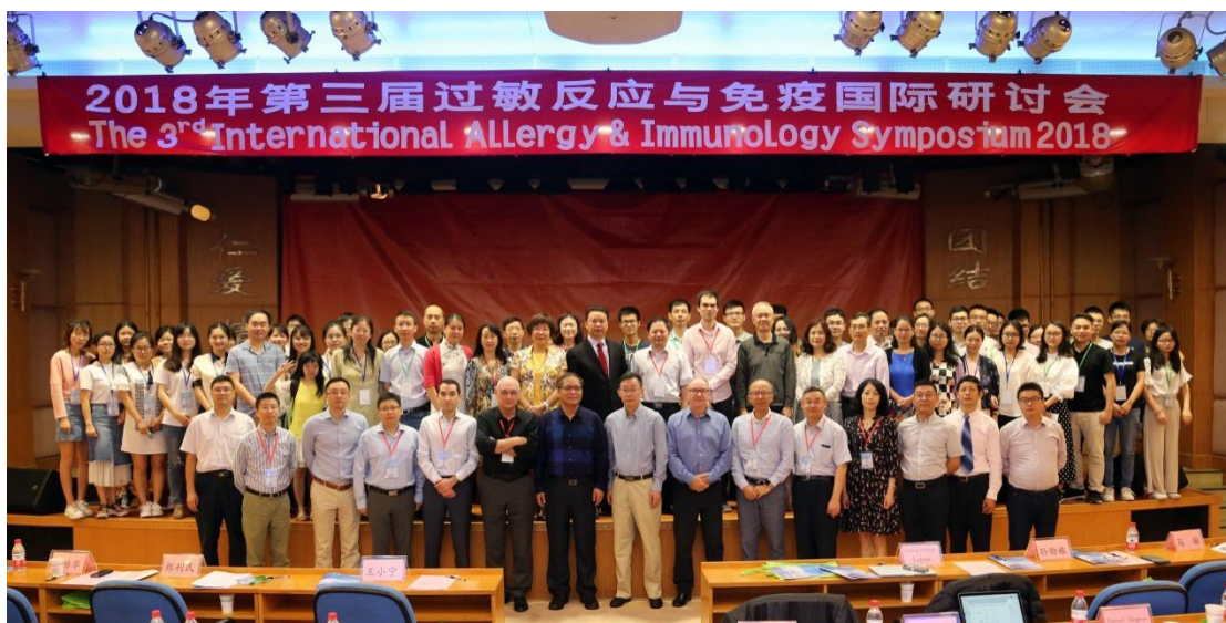
2018年第三届过敏反应与免疫国际研讨会合影