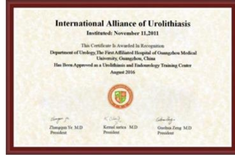
国际尿石症联盟 (IAU) 培训基地