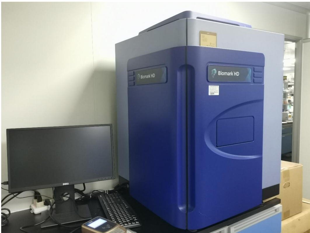
高通量基因分析仪