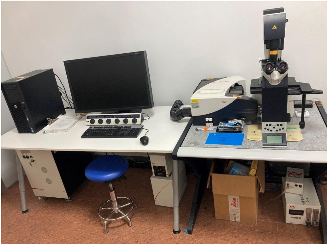
激光共聚焦显微镜