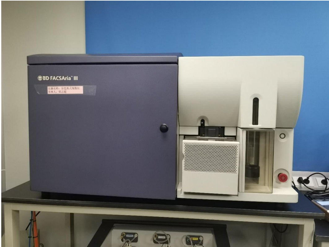
分选型流式细胞仪